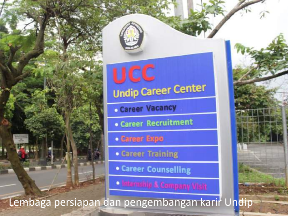
Lembaga persiapan dan pengembangan karir Undip