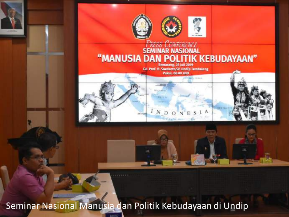
Seminar Nasional Manusia dan Politik Kebudayaan di Undip