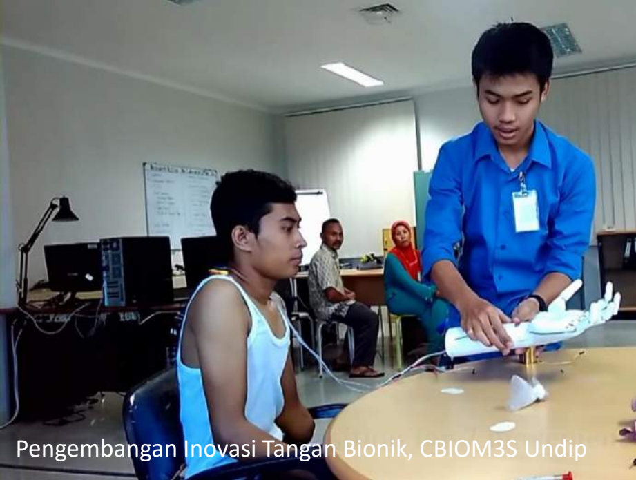
Pengembangan Inovasi Tangan Bionik, CBIOM3S Undip

9 INDUSTRY, INNOVATION AND INFRASTRUCTURE