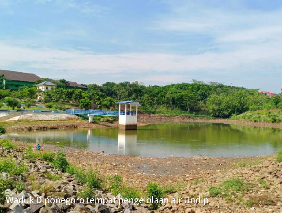
Waduk Diponegoro tempat pengelolaan air Undip