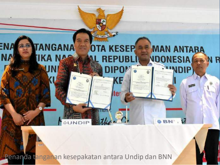
Penanda tangan kesepakatan antara Undip dan BNN