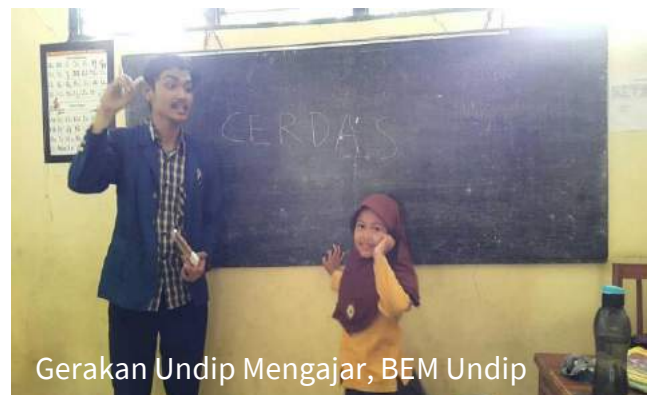
Gerakan Undip Mengajar, BEM Undip

Tim KKN Undip melaksanakan pendampingan belajar bagi siswa SD di lokasi KKNnya masing-masing. Aktivitas yang dilakukan antara lain belajar membaca, belajar menggambar, belajar bahasa Inggris, dan berbagai macam kuis yang dapat menambah pengetahuan mereka. Setiap siswa-siswi memiliki kemampuan yang berbeda-beda dalam menangkap materi pelajaran yang disampaikan. Mahasiswa KKN membantu para siswa dalam memahami materi lebih dalam.