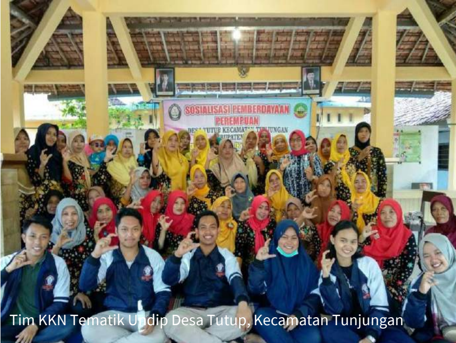
Tim KKN Tematik Undip Desa Tutup, Kecamatan Tunjungan