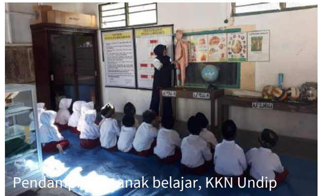
Pendampingan anak belajar, KKN Undip

Undip memiliki kebijakan untuk memberikan akses seluas-luasnya kepada masyarakat agar dapat menikmati akses belajar, perkuliahan, dan pelatihan tanpa membedakan suku, agama, ras, dan golongan sebagaimana tertuang dalam Surat Edaran Rektor No. 4 / UN7.P / SE / 2017. Undip juga berkomitmen untuk terus mengembangkan, mentransformasikan, dan menyebarluaskan iptek melalui kegiatan penelitian, serta karya iptek. Undip juga melakukan penelitian yang bertujuan untuk mengembangkan ilmu pengetahuan dan teknologi serta mampu menghasilkan inovasi untuk meningkatkan kesejahteraan masyarakat dan daya saing bangsa melalui Tridharma Perguruan Tinggi.