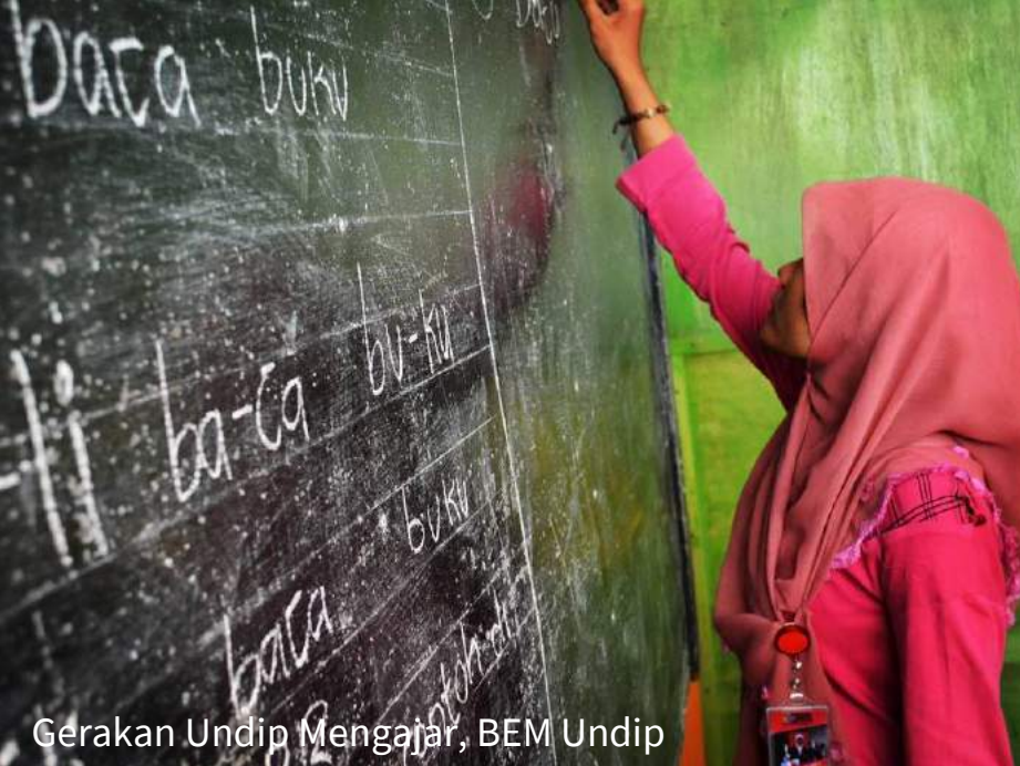
Gerakan Undip Mengajar, BEM Undip