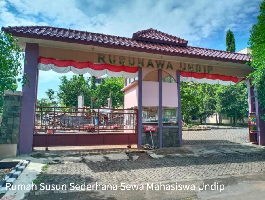
Rumah Susun Sederhana Sewa Mahasiswa Undip