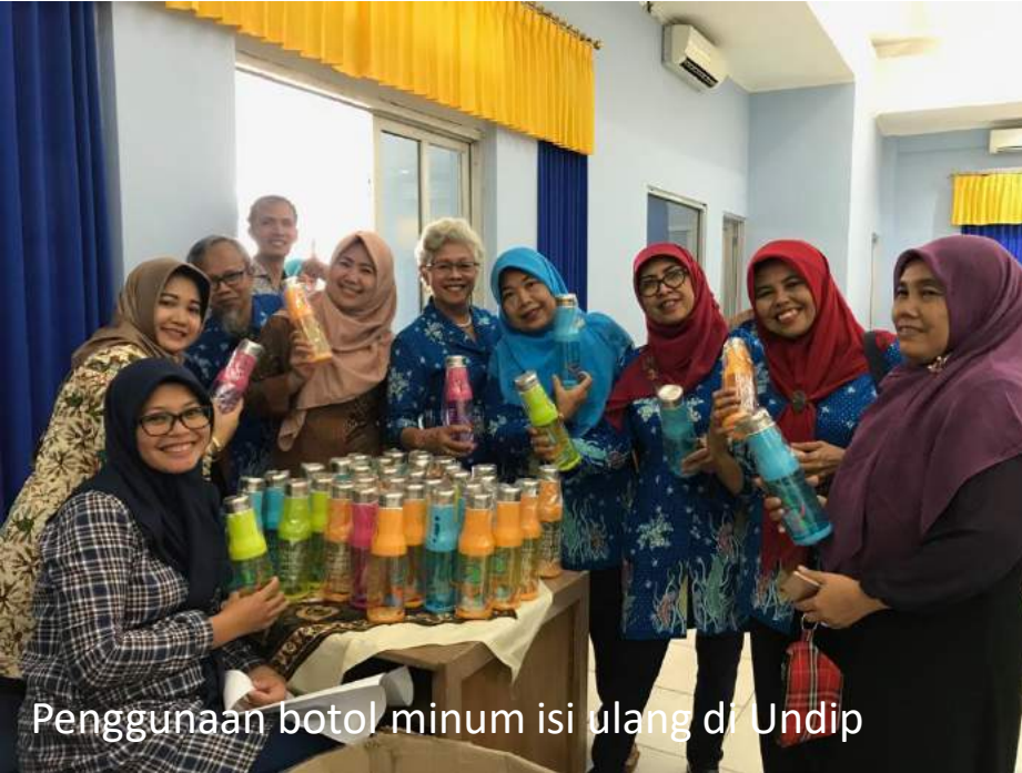
Penggunaan botol minum isi ulang di Undip