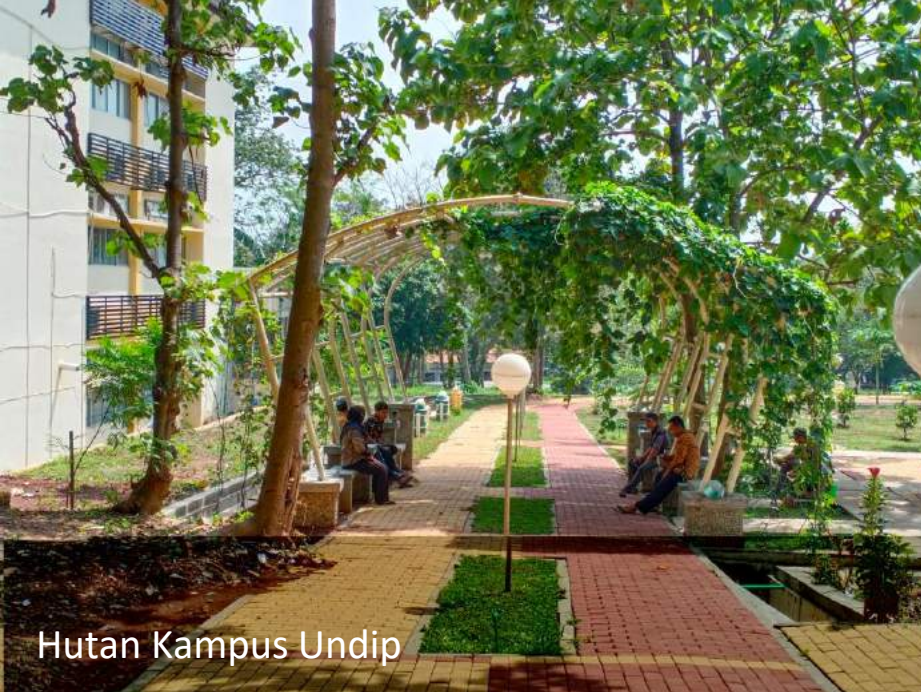
Hutan Kampus Undip