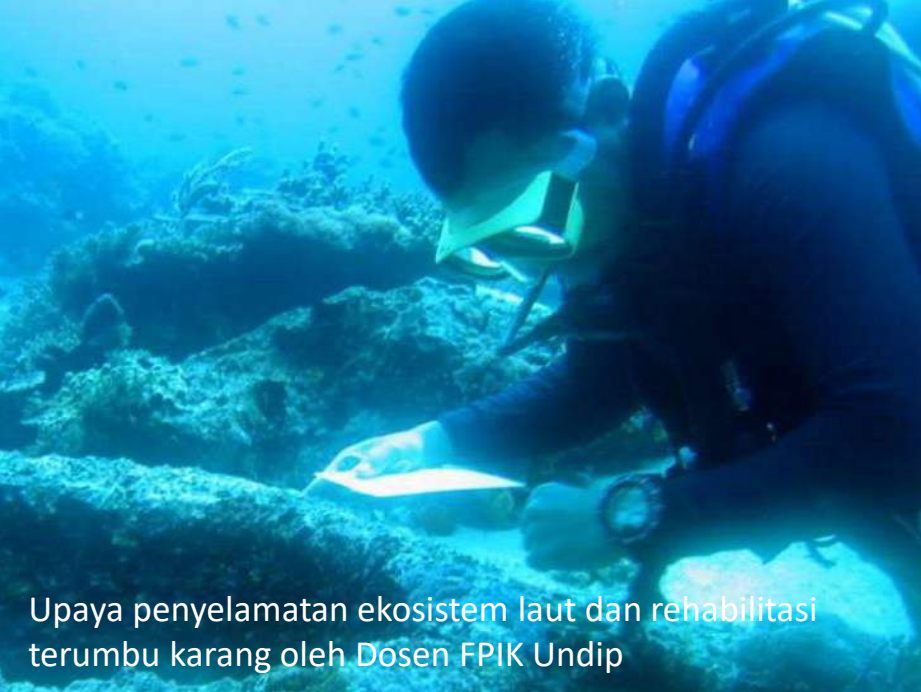
Upaya penyelamatan ekosistem laut dan rehabilitasi terumbu karang oleh Dosen FPIK Undip