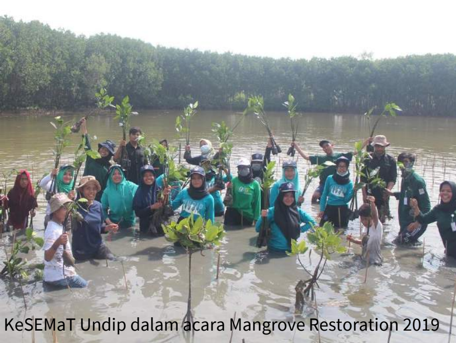
KeSEMaT Undip dalam acara Mangrove Restoration 2019