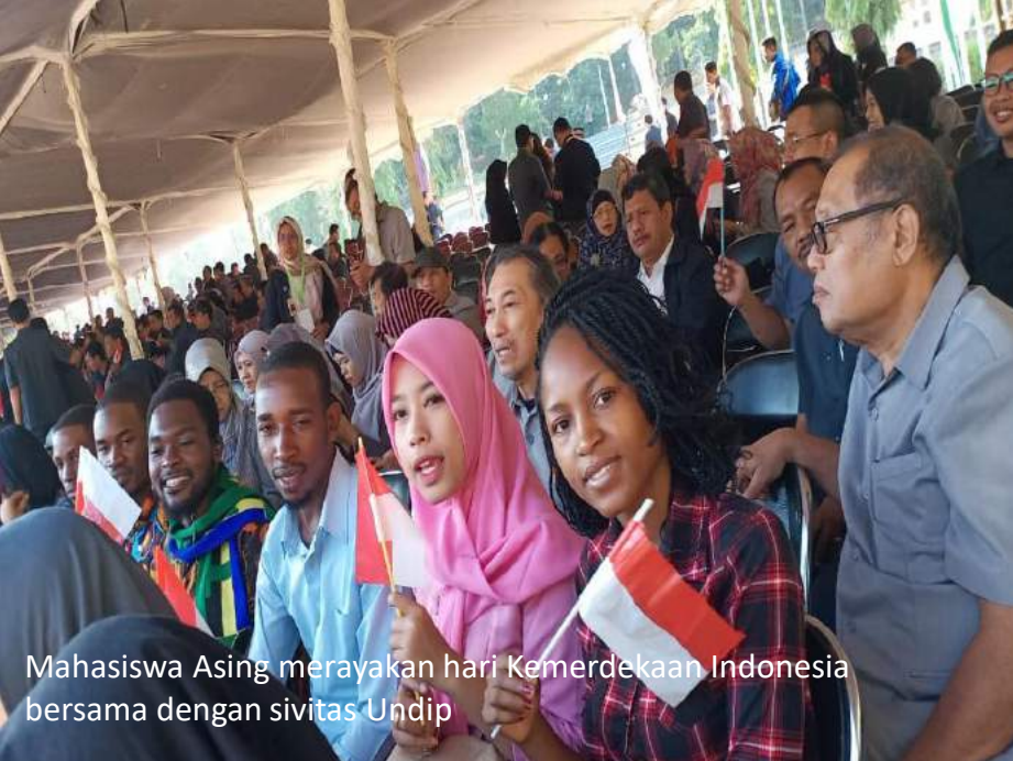
Mahasiswa Asing merayakan hari Kemerdekaan Indonesia bersama dengan sivitas Undip