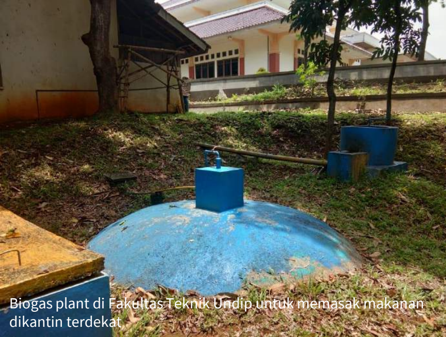
Biogas plant di Fakultas Teknik Undip untuk memasak makanan dikantin terdekat