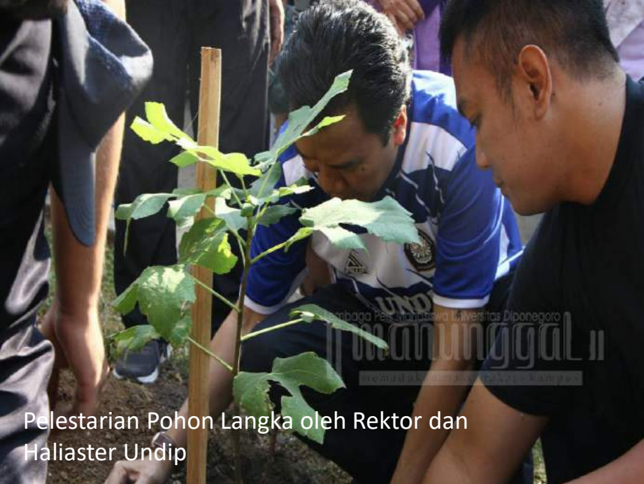
Pelestarian Pohon Langka oleh Rektor dan Haliaster Undip